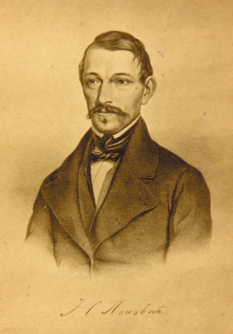
Јован Стерија Поповић