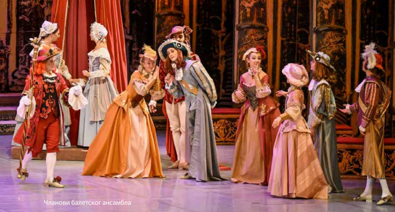
Чланови балетског ансамбла