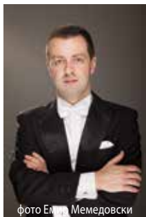
фото Емилијана Мемедовски