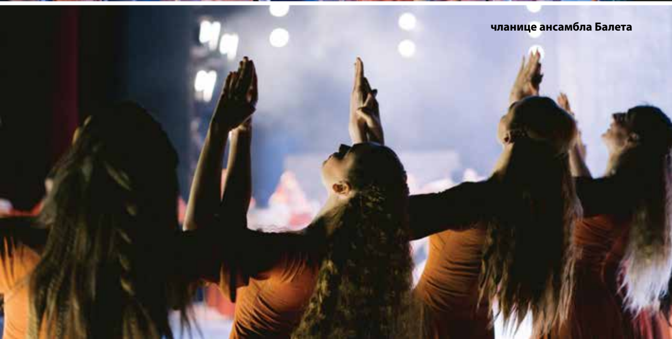
чланице ансамбла Балета