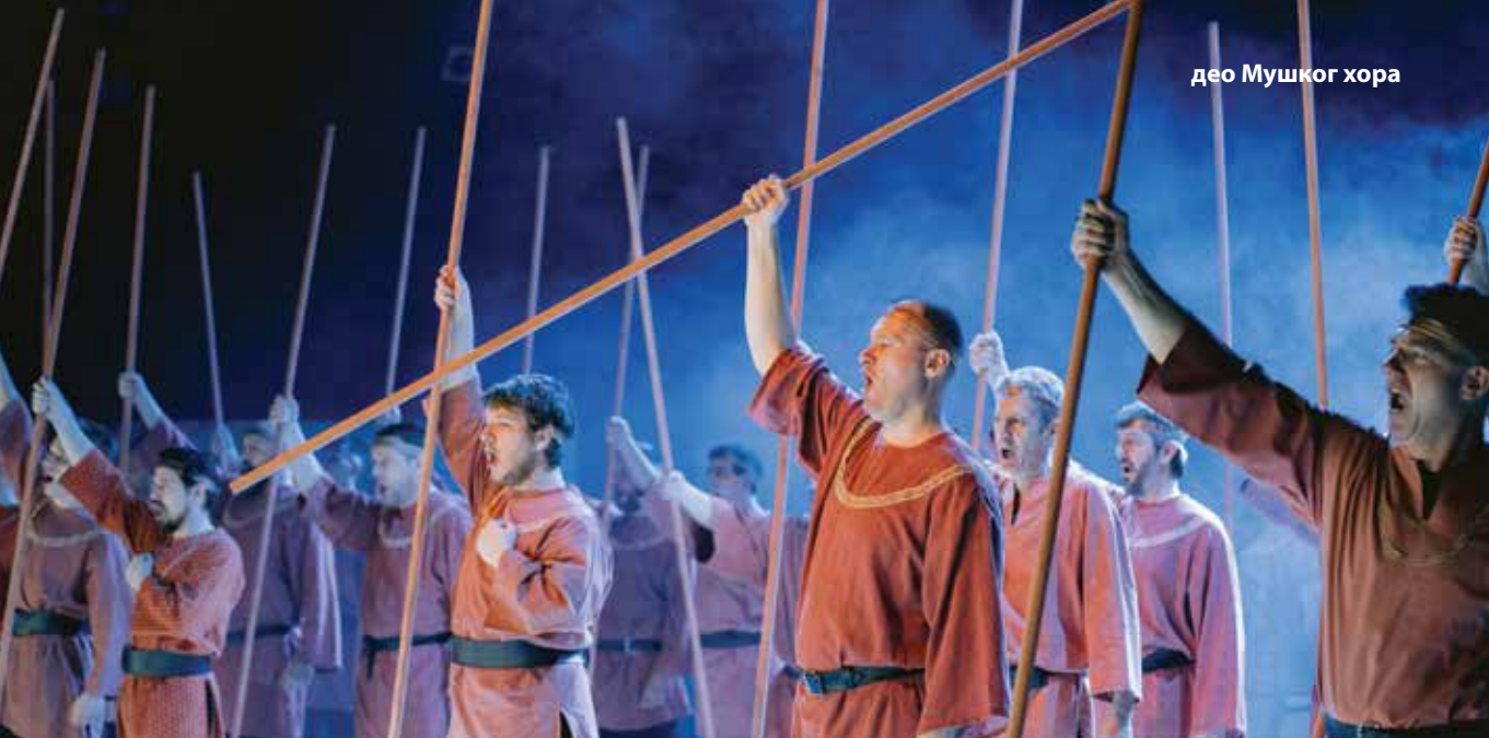
део Мушког хора