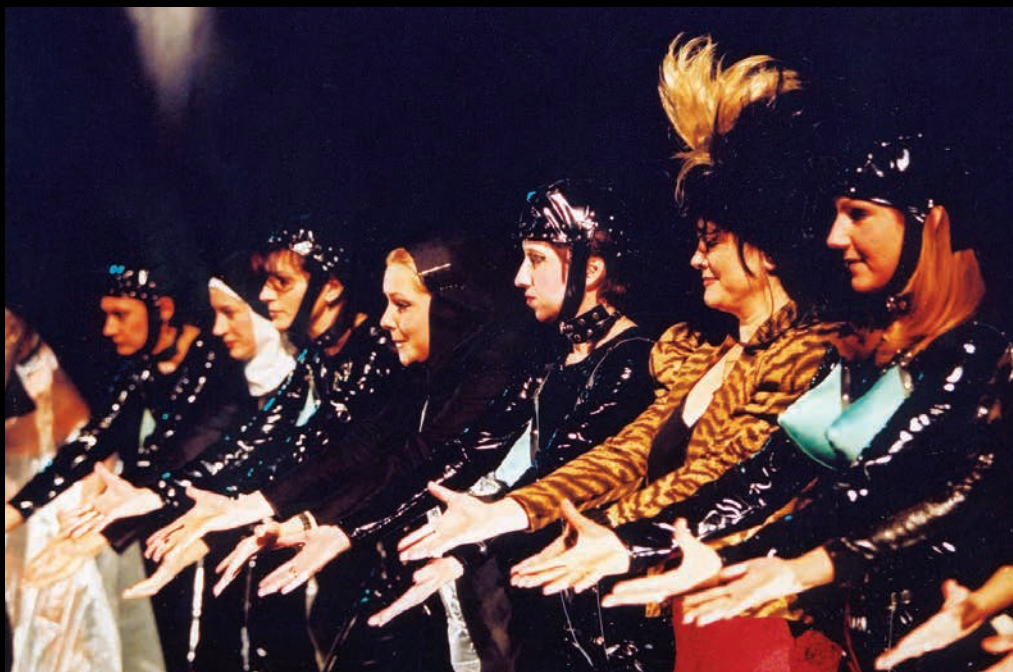
МАГБЕТ (2001): чланице Хора