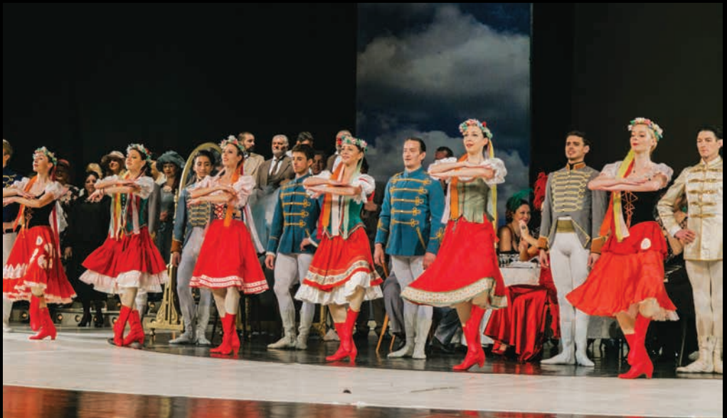
КНЕГИЊА ЧАРДАША (2016): чланови ансамбла Балета