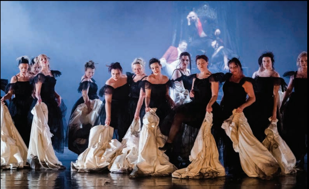
ФАУСТ (2019): чланице Хора