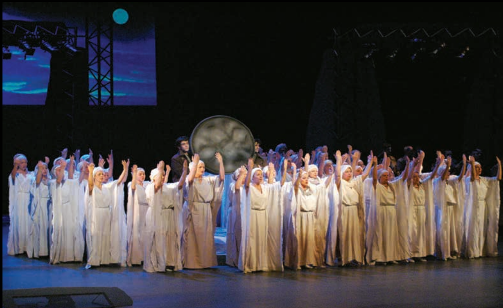
НОРМА (2006): чланице Хора