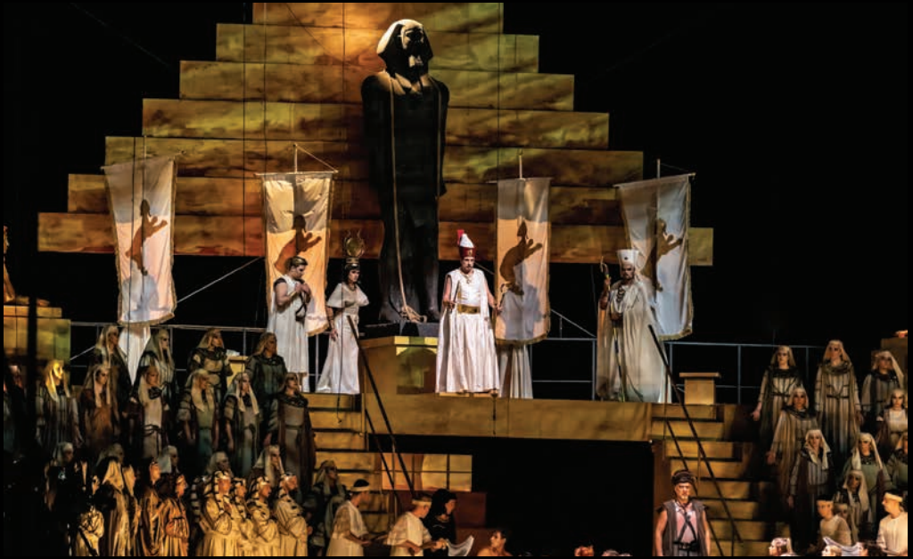
АИДА (2021): сцена из Aida