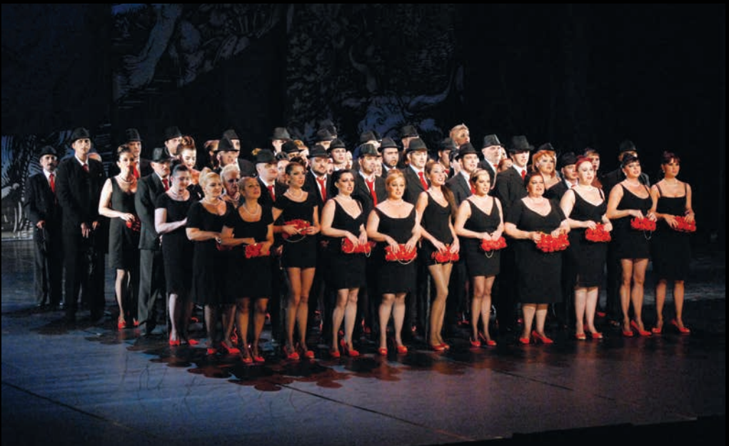
КАРМИНА БУРАНА (2010): Хор