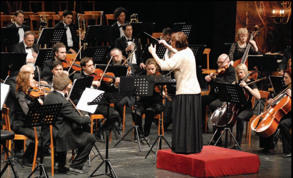
Гала концерт Опере СНП-а, диригент Жељка Милановић, 2010