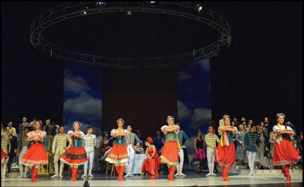
КНЕГИЊА ЧАРДАША (2007): ансамбл Балета