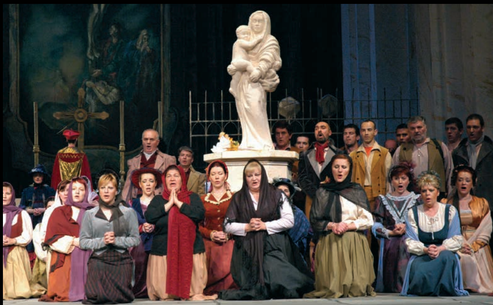
ТОСКА (2006): чланови Хора