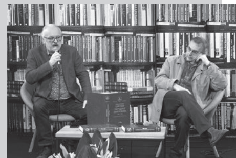
Youtube, print screen