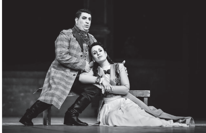
Представа „Евгеније Оњегин”