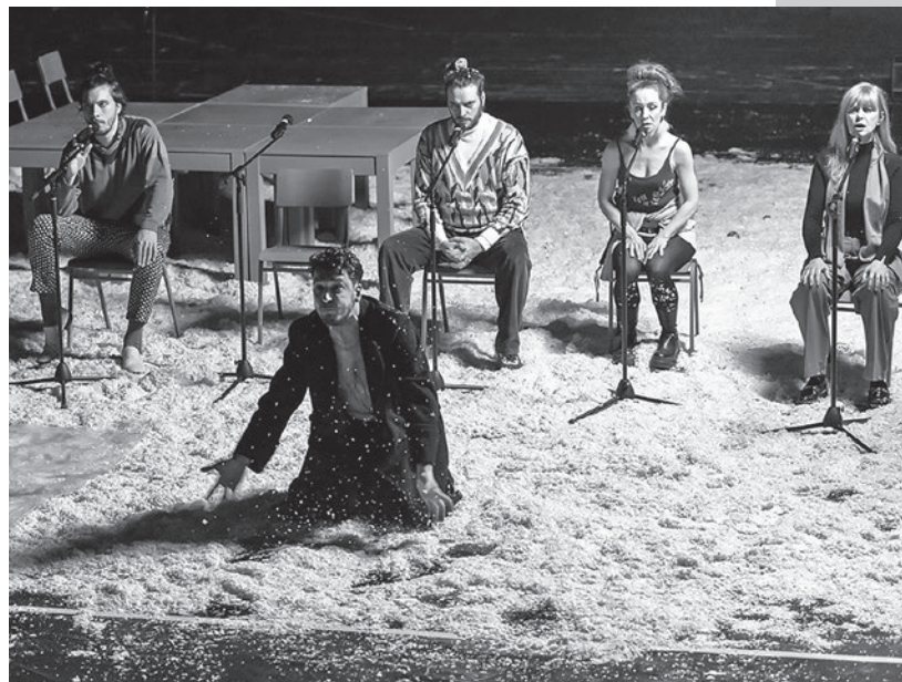
Представа „Kafka Machine”