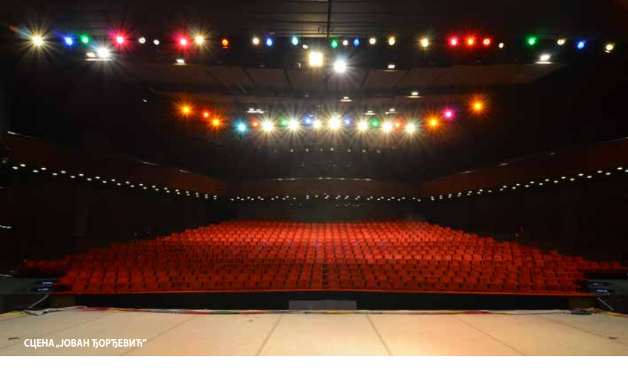
СЦЕНА „ЈОВАН ЂОРЂЕВИЋ“