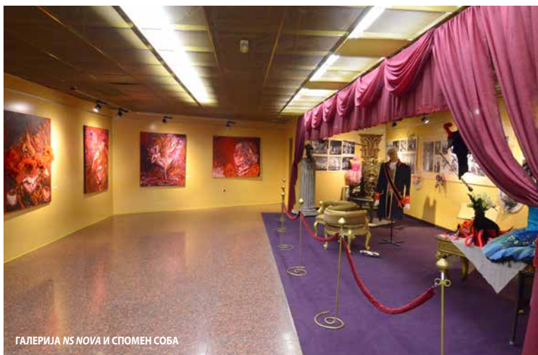
ГАЛЕРИЈА NS NOVA И СПОМЕН СОБА