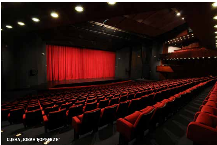
СЦЕНА „ЈОВАН ЋОРЂЕВИЋ“