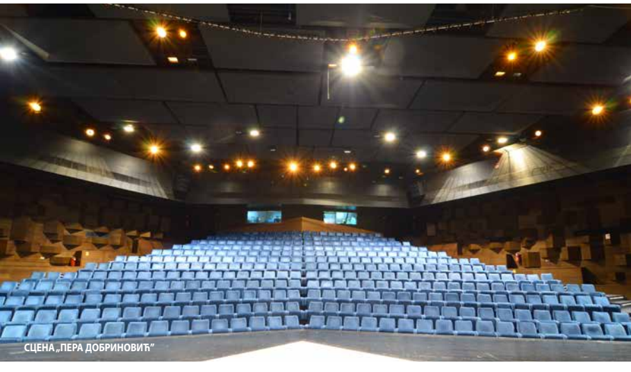
СЦЕНА „ПЕРА ДОБРИНОВИЋ“