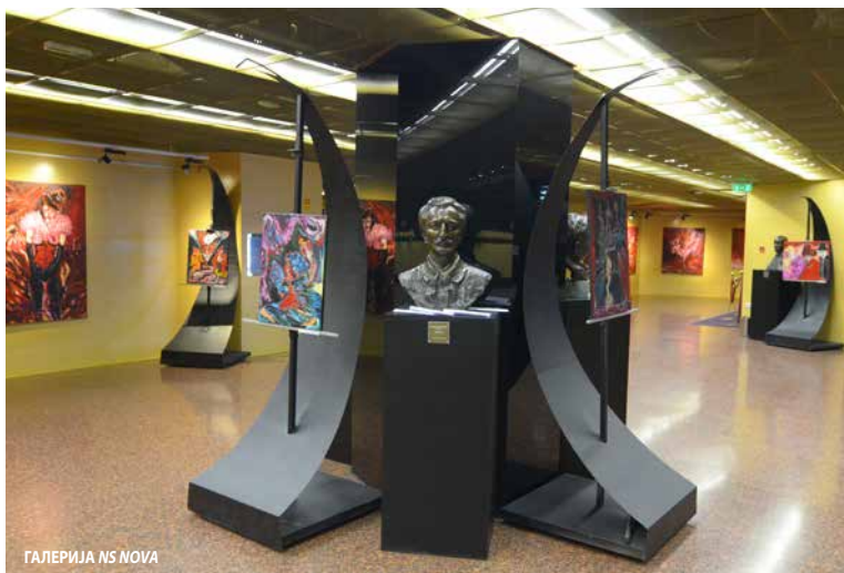
ГАЛЕРИЈА NS NOVA