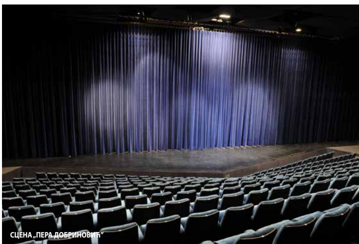
СЦЕНА „ПЕРА ДОБРИНОВИЋ“