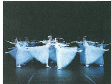
Балет Жизела, ансамбл Балета СНП

*директор Балета Српског народног позоришта