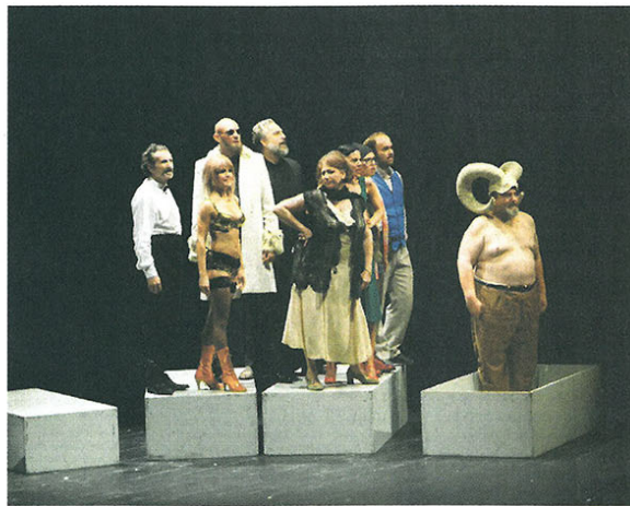
Из представе „Дух који хода“

*глумица, првакиња драме Српског народног позоришта